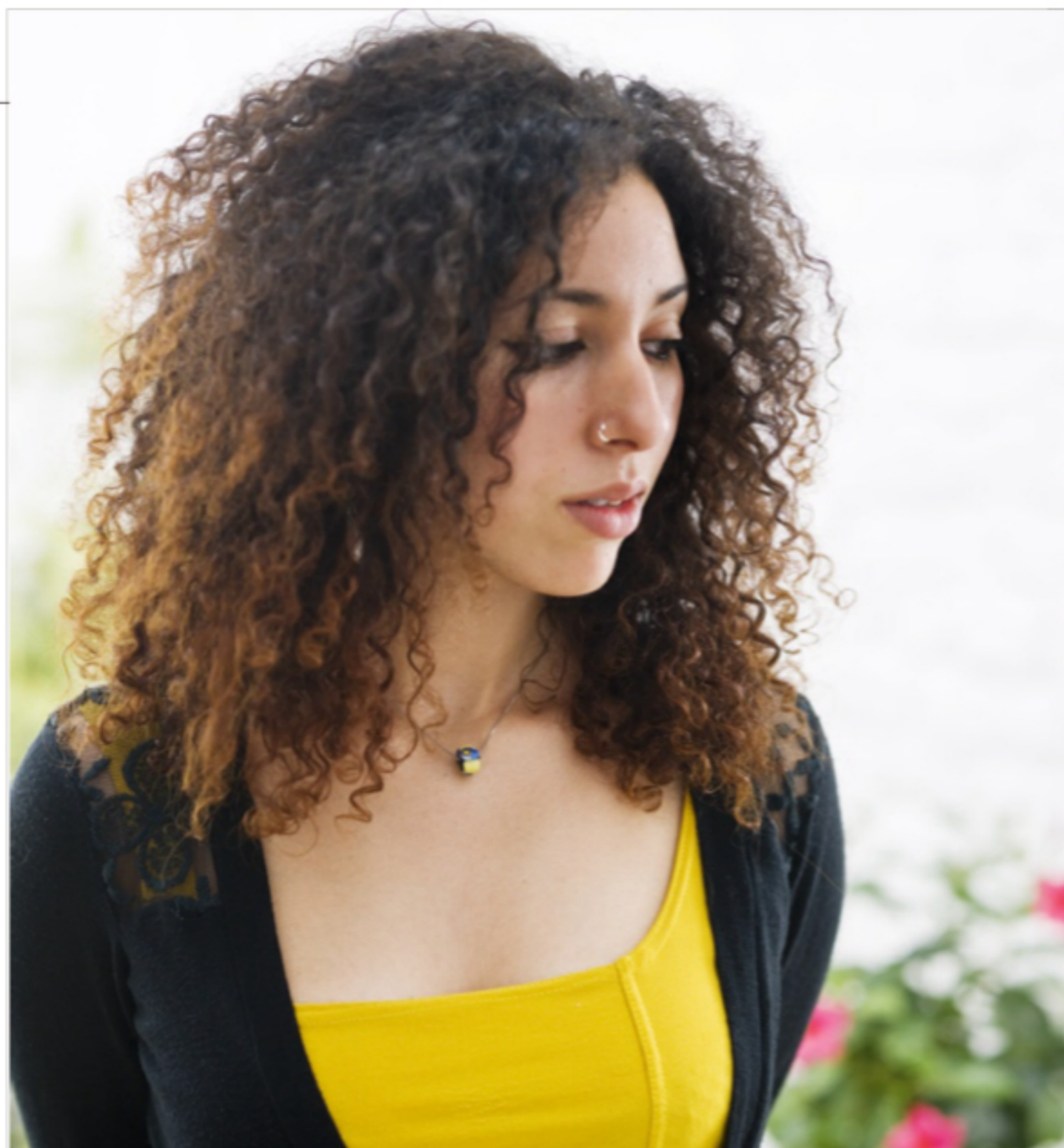
Sherazade: 'Hoe beter mijn ouders zich hier thuis voelden, hoe meer de anderen hen als buitenstaanders zagen.'